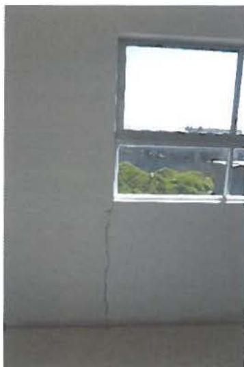
Fotografía N°5 Grietas en Sala Actividades N°1, en el 2° nivel.