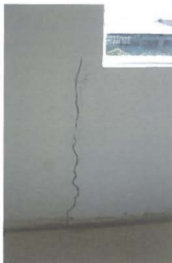
Fotografía N°6 Grietas en Sala Actividades N°1, en el 2° nivel.