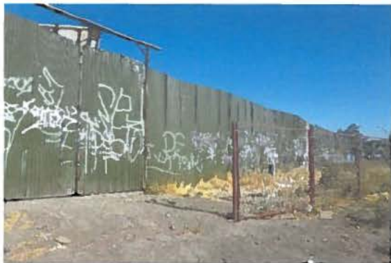
Fotografía N°1 Vista exterior, muestra abandono de las obras