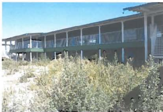
Fotografía N°2 Vista fachada y patio, muestra abandono de las obras