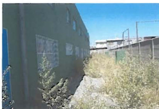
Fotografía N°4 Vista posterior, muestra abandono de las obras