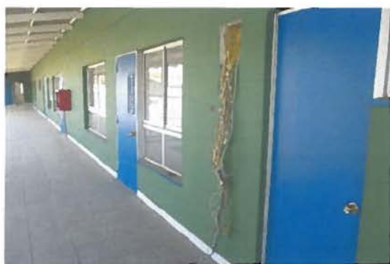
Fotografía N°3 Vista primer piso, muestra abandono de las obras